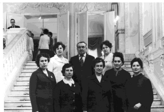
На снимке: Делегаты IX-го Всероссийского съезда от Ивановского областного комитета ОКК