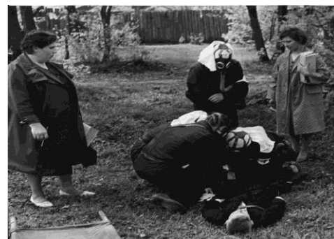
На городских соревнованиях санитарных дружин

Учреждения здравоохранения и Общество Красного Креста рассматривали вопросы борьбы с пьянством и алкоголизмом и их профилактику как одно из ответственных направлений в своей деятельности. Наркологические посты повседневно оказывали помощь наркологической службе в получении сведений о больных алкоголизмом по сигналам из медицинского вытрезвителя, выявлении на работе лиц в нетрезвом состоянии, а также в привлечении к поддерживающему лечению лиц, выписанных из лечебно-трудовых профилакториев. Ежегодно проводились слеты общественных наркологических постов с целью изучения и обмена опытом работы лучших общественных наркопостов. Вели воспитательную работу и пропаганду, направленную на борьбу с пьянством и алкоголизмом как социальным злом, причиняющим вред здоровью, семье, обществу, мешающему воспитывать подрастающее поколение.