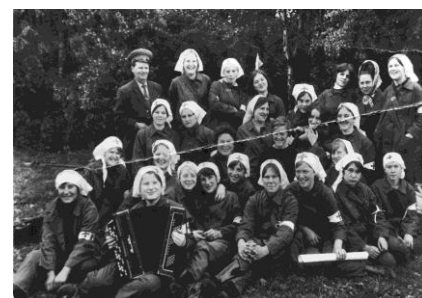
Санитарная дружина медицинского училища