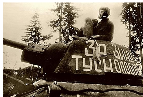
Рис. 3. Танк Т-34 с лозунгом, 1944